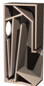
Darstellung des Innenaufbaus der Fidelio